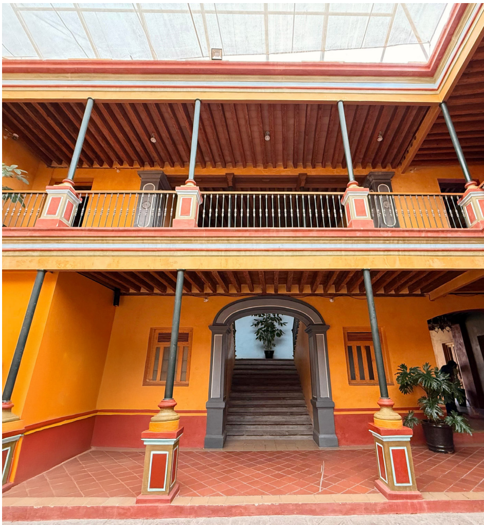
Edificio del Instituto de Estudios Legislativos

complemento del trabajo de campo es un adecuado trabajo de gabinete. Esa será la labor del INESLE los próximos años: apoyar el trabajo legislativo con calidad, prontitud y eficacia.